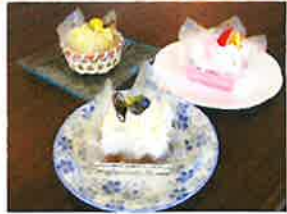
— 3種のモンブラン —