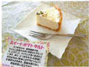
— スイートポテトタルト —