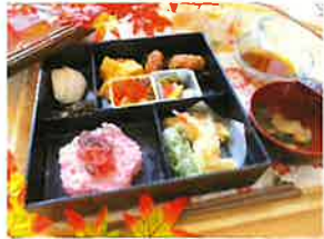
— 敬老会の祝御前 —