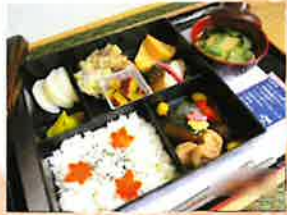
— 秋の行楽弁当 —