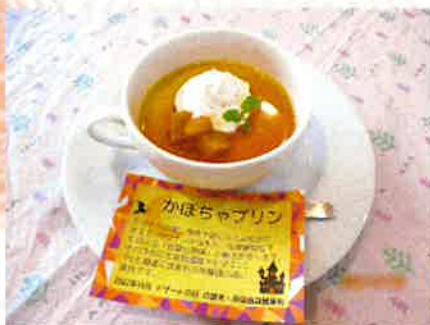
— かぼちゃプリン —