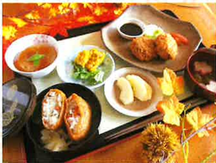
— 五目いなり&メンチカツ —