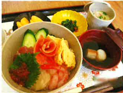
— 開設記念 海鮮ちらし —