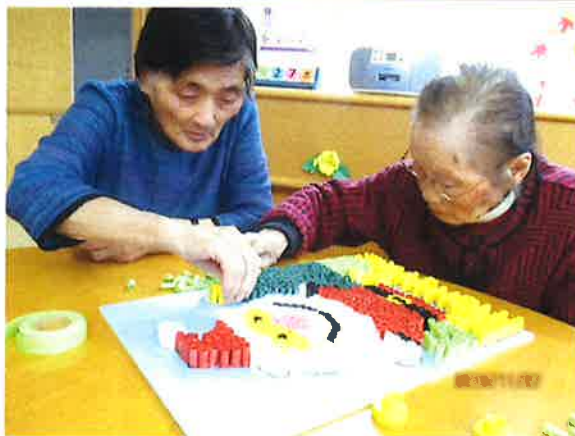
デイサービスセンターろっかえん 営業日 年中無休 営業時間8時30分～16時00分(18時00分まで延長可能) お問い合わせ先 TEL 0136-22-0808

クリスマスに向けた創作活動を行っています。 皆さん完成を楽しみにしており、着々と作業が進んで います。麓華苑にお越しの際は是非、ご覧になっ てください。