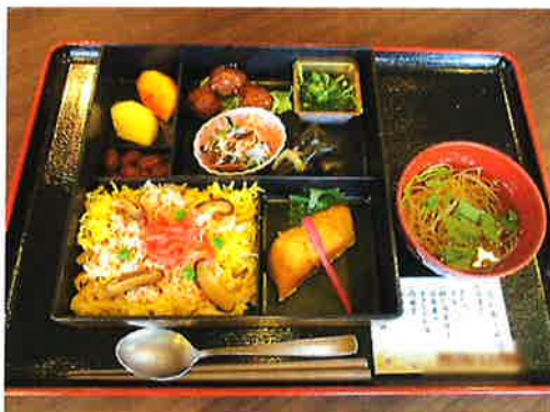
—かにかめし弁当— 長万部のかにかめしを イメージしました