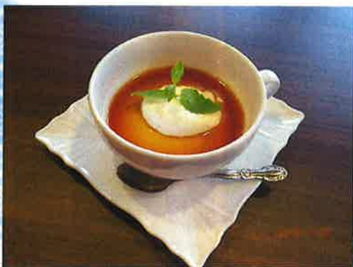
—かぼちゃプリン— 甘味の強いかぼちゃは お菓子作りにぴったりです