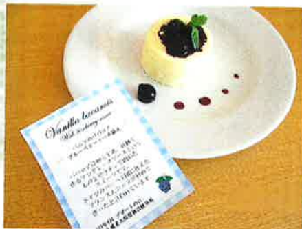
— ババロア —