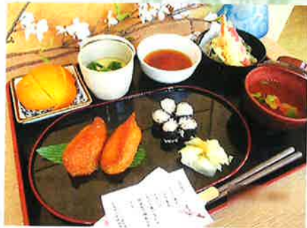
— さくら寿司御膳 —