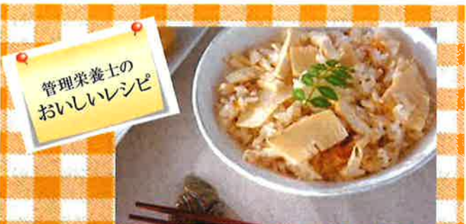
— 桜寿司御膳 — 彩り鮮やかに春らしい メニューにしました